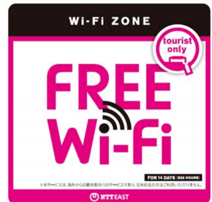
図1 FREE Wi-Fi マーク

無料Wi-Fiサービスによって旅行者の満足度が向上し、訪日外国人需要を創出できることを期待しています。